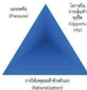
ภาพ การพัฒนาของทฤษฎีสามเหลี่ยมการทุจริต