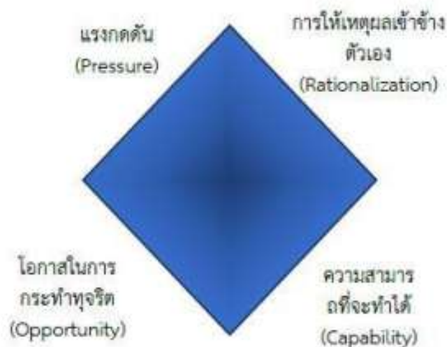
การพัฒนาของทฤษฎีสี่เหลี่ยมการทุจริต (Four-sided Diamond)